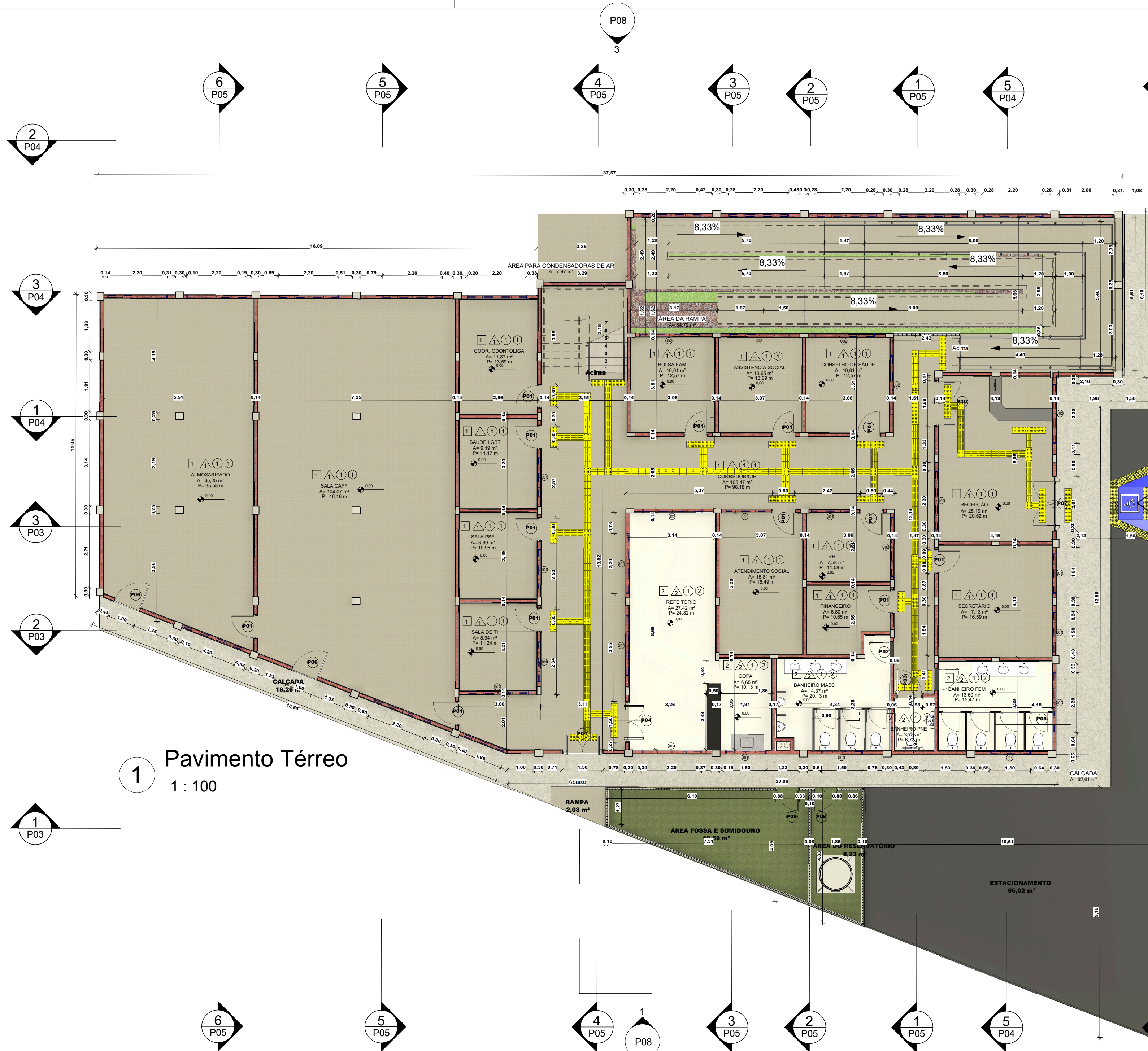
1 Pavimento Térreo 1 : 100